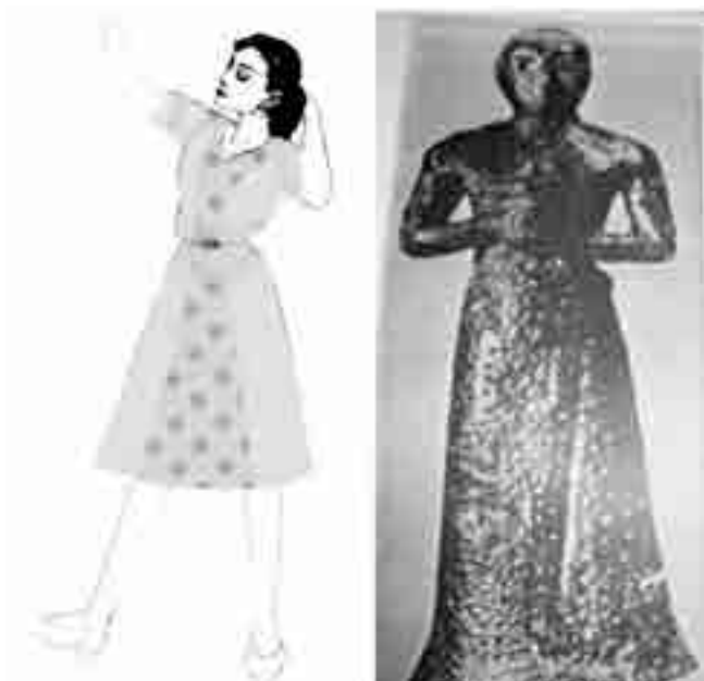
شکل ۳- تصویر ایده گرفته شده و اجرای رنگی طرح شماره ۱

این مدل شامل یک پیراهن بوده که قد آن تقریباً کوتاه تاروی زانو است. جنس این لباس از تافته ابریشم و تافته معمولی می باشد که از دو نوع پارچه یکی ساده و دیگری طرح دار در آن استفاده شده است. این لباس دارای آسترکشی دابل می باشد، که آستری هم مثل رویه برش و دوخت گردیده است.