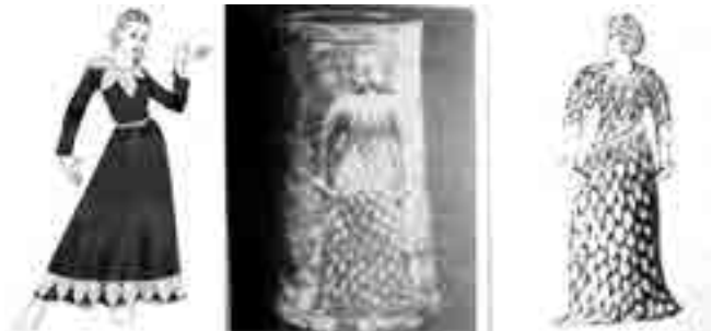
شکل ۵- تصویر ایده گرفته شده و اجرای رنگی مدل شماره ۲