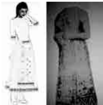
شکل ۱۱- تصویر ایده گرفته شده و اجرای رنگی مدل شماره ۵

لبه آستین و پاچین قرار دارد جزء بافت پارچه می‌باشد و لبه آن هم، اضافه نخ تار بصورت آویز و گره خورده قرار گرفته است. در قسمت جلو و پشت این لباس دو تکه مستطیل شکل قرار گرفته که در قسمت درز کمر روی لباس متصل می‌شود در این تکه ها علاوه بر حاشیه‌ای که در قسمت بالا و پائین قرار گرفته است از نخ‌های رنگی نیز برای تزئین در کل سطح پارچه استفاده است.