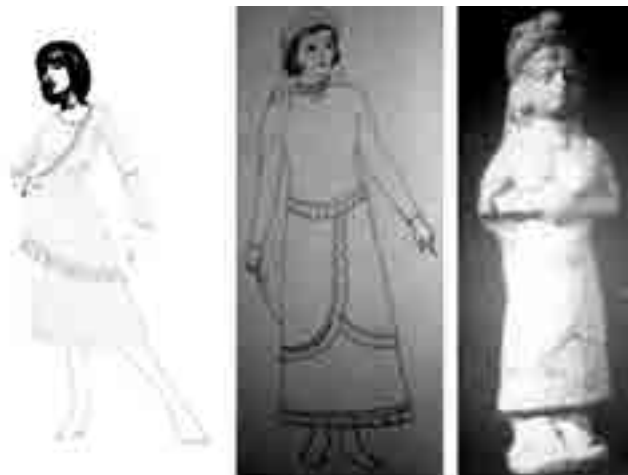
شکل ۹- تصویر ایده گرفته شده و اجرای رنگی مدل شماره ۴

قد این لباس تقریباً تا زیر زانو می‌باشد و برای ترسیم الگوی آن در جلو و پشت به الگوی کامل نیاز است. یک الگو از قسمت بالاتنه تا قسمت دامن رویه رولت می‌شود و یک الگوی دیگر از کمر دامن تا قد لبه دامن.