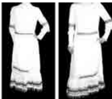
شکل ۱۲- لباس دوخته شده مدل شماره ۵

لبه آستین و پاچین قرار دارد جزء بافت پارچه می‌باشد و لبه آن هم، اضافه نخ تار بصورت آویز و گره خورده قرار گرفته است. در قسمت جلو و پشت این لباس دو تکه مستطیل شکل قرار گرفته که در قسمت درز کمر روی لباس متصل می‌شود در این تکه ها علاوه بر حاشیه‌ای که در قسمت بالا و پائین قرار گرفته است از نخ‌های رنگی نیز برای تزئین در کل سطح پارچه استفاده است.