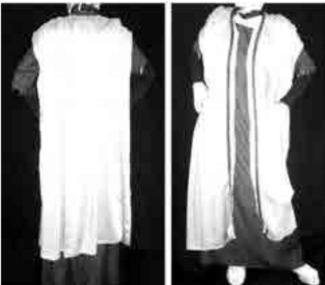
شکل ۸- لباس دوخته شده مدل شماره ۳

این مدل از الگوی بدون پنس مدل سازی گردیده است و در قسمت انتهای دامت به سمت بالا تا قسمت خط کف حلقه اوزمان می خورد، آستین این لباس از قسمت آرنج برش می خورد و در همان قسمت هم به سمت بالا و هم به سمت پایین در قسمت آرنج چین می خورد که در دوخت آن را کش دوزی می کنیم، پشت و جلوی این لباس روی دولای بسته قرار می گیرد.