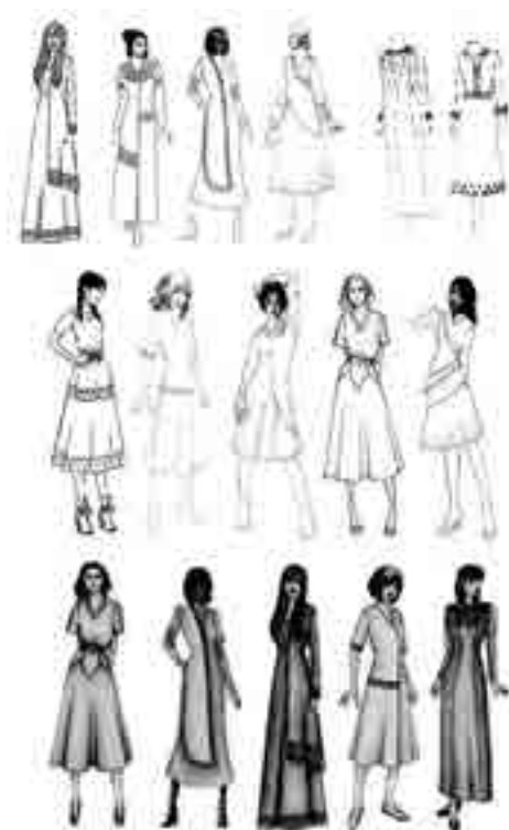
شکل ۲- نمونه اتوهای طراحی تایید شده

در شکل ۲ نمونه اتوهای طراحی تایید شده مشاهده می شود. تمام این نمونه ها بر اساس استوری بورد نشان داده شده در شکل ۱ طراحی شده اند.