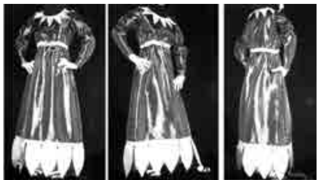
شکل ۶- لباس دوخته شده مدل شماره ۲