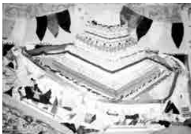
شکل ۱- استوری بورد مورد استفاده

بر اساس اطلاعات و یافته هایی که از تصاویر آن دوران (عیلام) جمع آوری شد و آن چه که از جنس، تزیینات، برش ها و مدل آن ها برداشت گردید لباس هایی با استفاده از این مشخصه ها طراحی گردید. در شکل ۱ استوری برد مورد استفاده در این تحقیق نشان داده شده است.